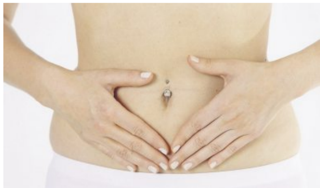
Myome sind zwar üblicherweise nicht gefährlich, können aber die Lebensqualität durch verstärkte Blutungen und Schmerzen stark beeinträchtigen.

INFO Die Abendsprechstunde „Frauensache – Wenn die Gebärmutter Ärger macht“ findet statt am Montag, 9. Mai, um 18.30 Uhr im Pavillon der Schule für Gesundheitsberufe des St. Vincenz-Krankenhauses Datteln, Kirchstr. 27. Eintritt frei!