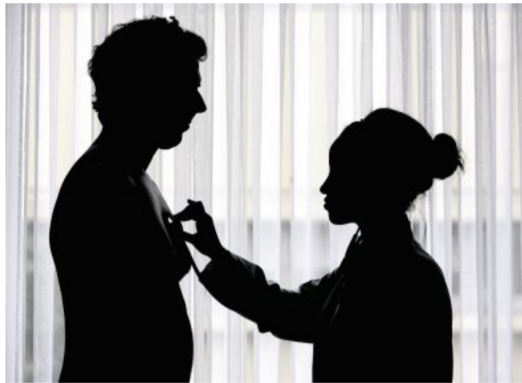
Ob das Herz gesund ist, lässt sich nicht immer auf Anhieb sagen. Manche Formen des Vorhofflimmerns werden auch erst zufällig bei einem EKG entdeckt.

Bei einer Herzschwäche ist die „Pumpe“ nur eingeschränkt leistungsfähig, so dass wichtige Organe nicht mehr ausreichend mit Blut versorgt werden. Die Folge: Patienten leiden unter Luftnot, Konzentrationsschwäche, Müdigkeit und geschwollenen Beinen. Bei dieser Krankheit ist die elektrische Überleitung gestört.